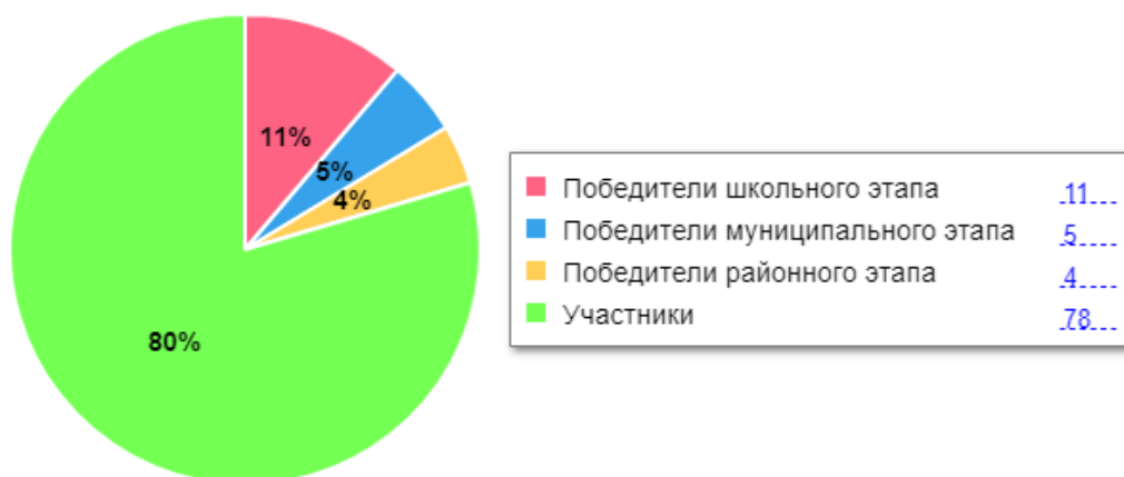
Диаграмма по результатам участия школьников во ВсОШ

В 2023 году был проанализирован объем участников конкурсных мероприятий разных уровней. Дистанционные формы работы с учащимися, создание условий для проявления их познавательной активности позволили принимать активное участие в дистанционных конкурсах регионального, всероссийского и международного уровней. Результат – положительная динамика участия в олимпиадах и конкурсах, привлечение к участию в интеллектуальных соревнованиях большего количества обучающихся Школы.