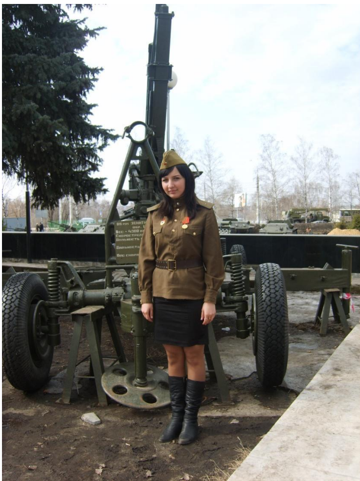
На экскурсии в музее-диораме. Воронеж. 2010.