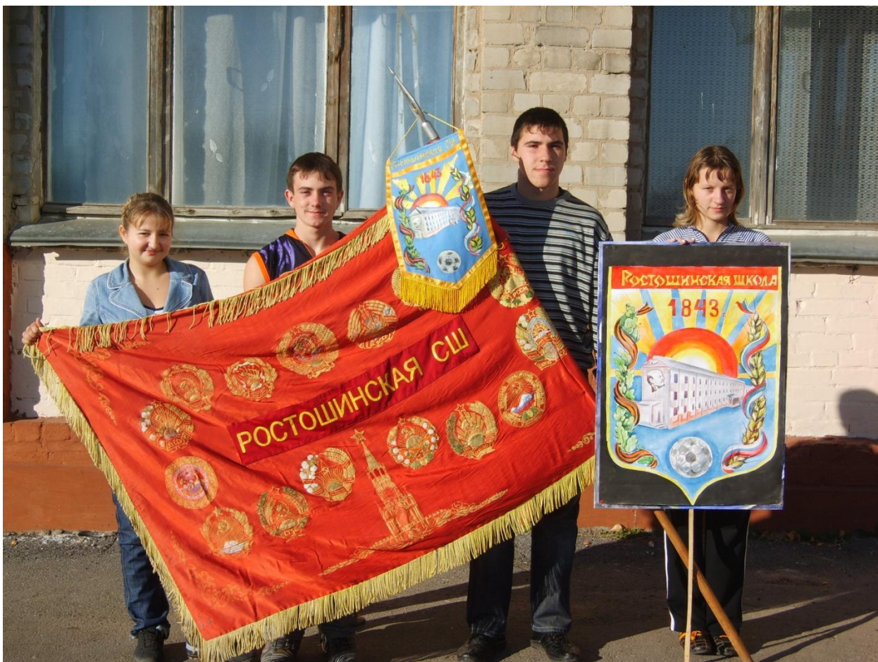
Члены отряда «Поиск» со Знаменем и Гербом школы.