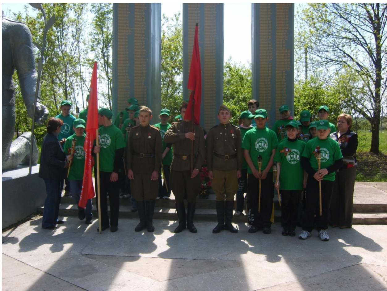
Факельное шествие по мемориалам Эртильского района. 5.05.2011.

Свою историю Пост №1 села Ростоши ведет с 1975 года. Именно в этом году 7 ноября был открыт мемориал погибшим односельчанам в годы Великой Отечественной войны. На открытие был выставлен Почетный караул из пионеров и комсомольцев школы. Почетный караул выставлялся на 9 мая и 7 ноября. С 1992 года – на День Победы.