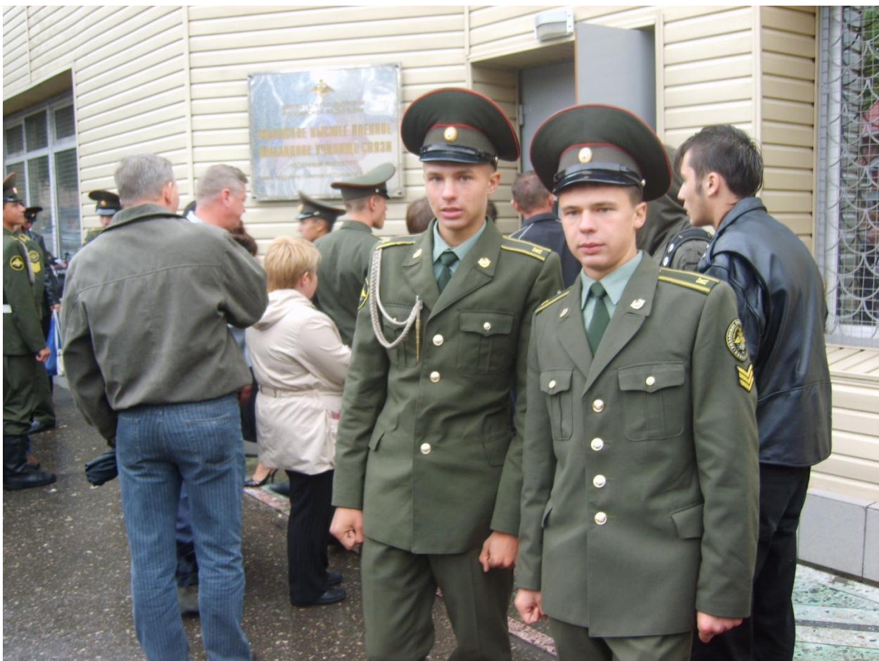
Вчера юнармейцы, сегодня- курсанты, завтра- офицеры.

Более тысячи ростовичей побывало в Почетном карауле. Юное поколение, пройдя школу Поста № 1, впоследствии с честью выполняли свой долг перед Родиной. И сегодня воспитанники Поста № 1 продолжают традиции ратной службы на благо Отечества. 10 человек проходят срочную службу, двое учатся в Высших военных заведениях, восемь человек служат на различных офицерских должностях во всех уголках нашей необъятной России.