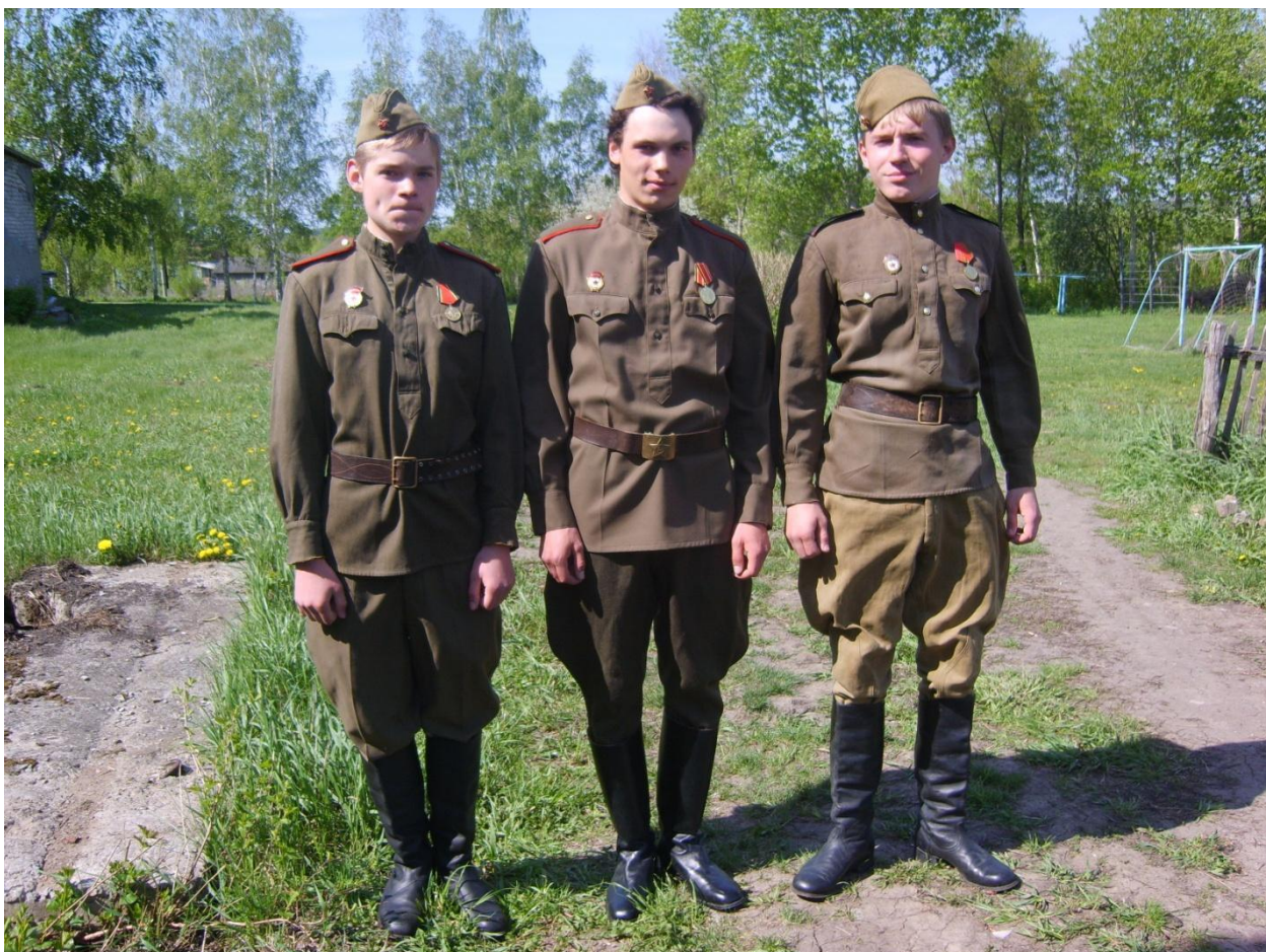
Перед заступлением на Пост №1.