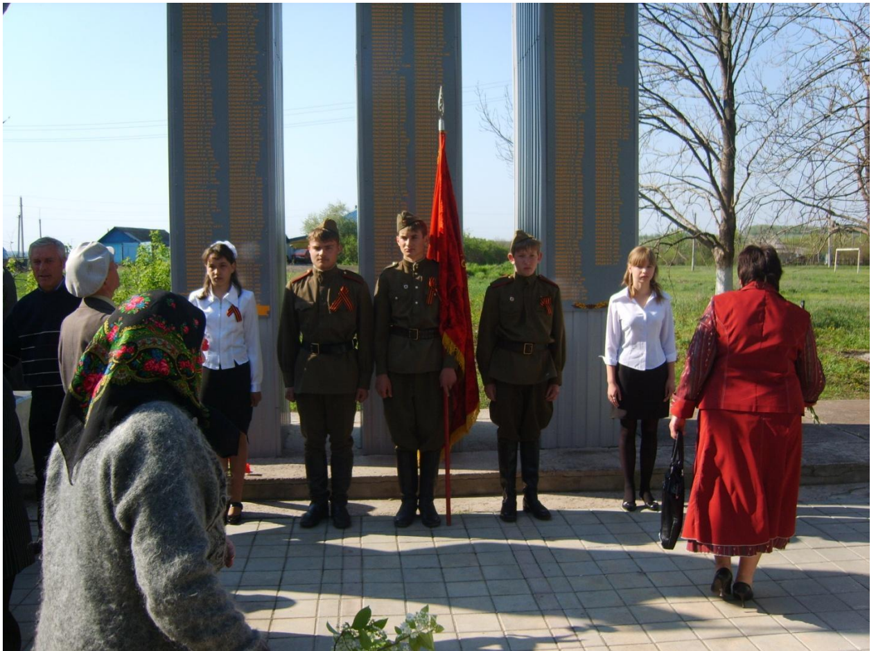
На Посту №1. 9.05.2011.

VII. Воспитательная работа по подготовке и несению службы на Посту № 1.